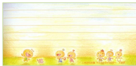
夕暮れバージョン【横書き】